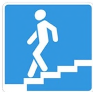
Подземный пешеходный переход