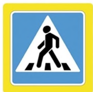
Наземный пешеходный переход